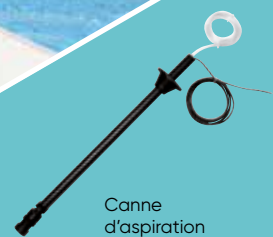
Canne d'aspiration fournie